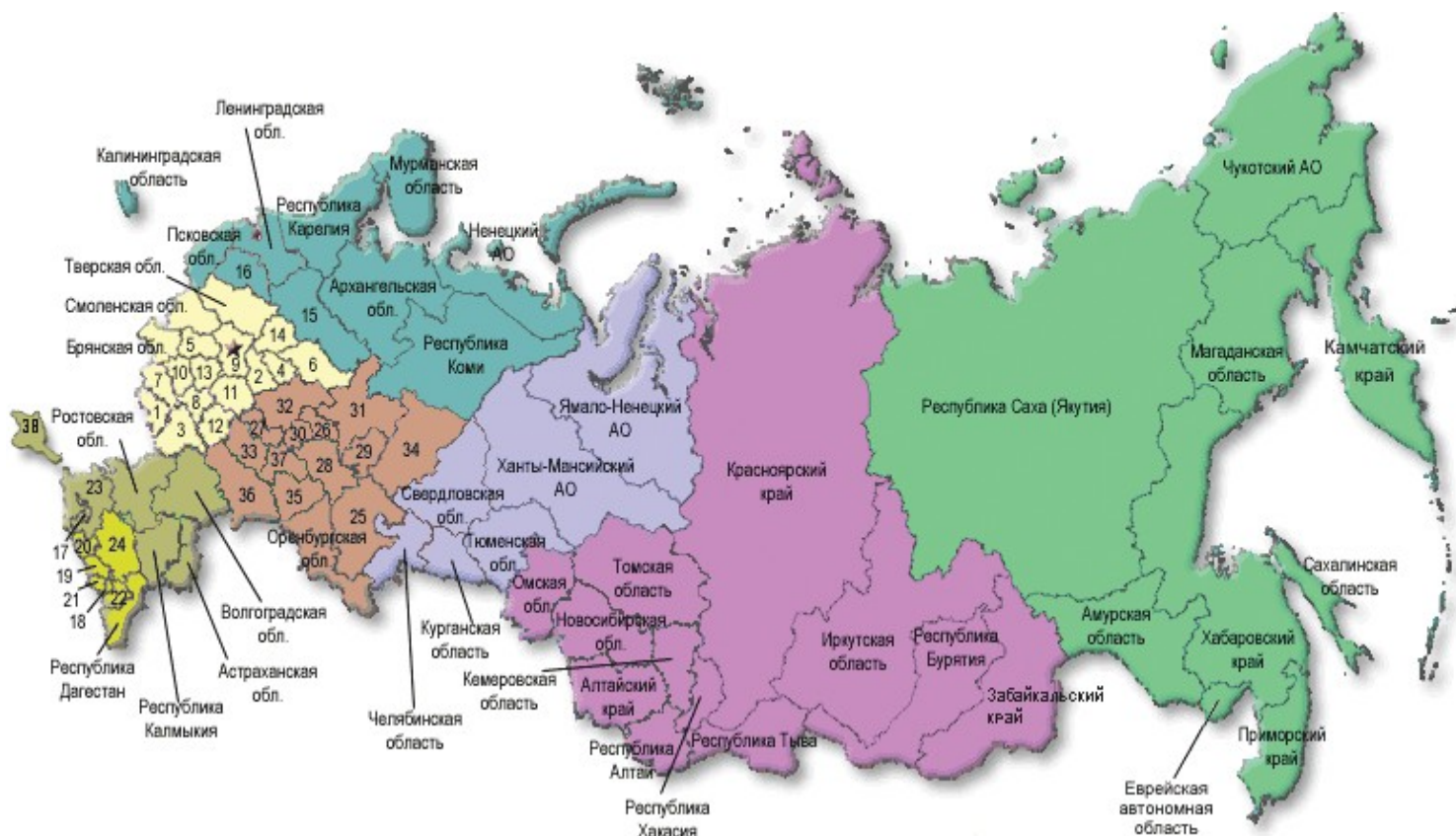
Рисунок 2 - Территориальные органы Федеральной службы государственной статистики

Федеральная служба государственной статистики осуществляет свою деятельность непосредственно и через свои территориальные органы. В настоящее время функционирует 82 территориальных органа Росстата, осуществляющих сбор и обработку первичных статистических данных и административных данных для формирования и предоставления в Росстат, органам государственной власти субъектов Российской Федерации, органам местного самоуправления, организациям и гражданам официальной статистической информации о социальных, экономических, демографических, экологических и других общественных процессах в субъектах Российской Федерации [4].